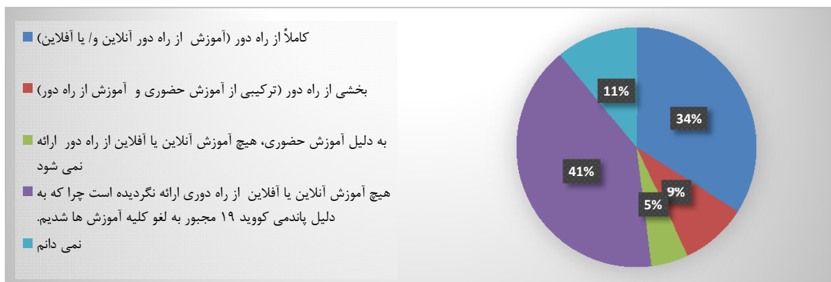
نمودار ۱. نحوه ارائه آموزش‌های فنی و حرفه‌ای در زمان کرونا [۵]

بر اساس گزارش یونسکو، این ویروس بر حدود ۸۱ میلیون دانشجوی آموزش عالی در سراسر جهان تأثیرگذار بوده است [۲]. در آمریکای لاتین و جزایر کارائیب تا تاریخ ۹ آوریل ۲۰۲۰، در حدود ۲۳/۴ میلیون دانشجو و حدود ۱/۴ میلیون نفر از استادان آموزش عالی (بیش از ۹۸ درصد جمعیت دانشجویان و استادان آموزش عالی این منطقه) تحت تأثیر بحران قرار گرفته‌اند [۱]. همچنین تا تاریخ ۱۳